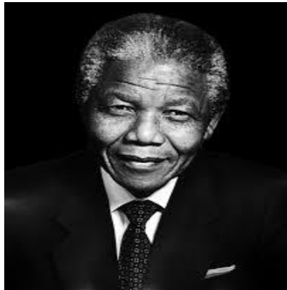
SU FOTOGRAFIA REAL TOMADO DE IMÁGENES DE GOOGLEE